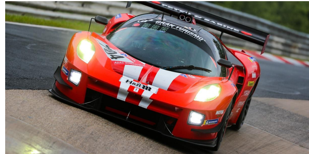
nächstmöglich zum Nummernschild positioniert