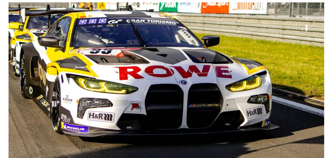
Ausnahmeregelung: 2 Aufkleber BMW, AMG (in Absprache mit SPORTTOTAL)