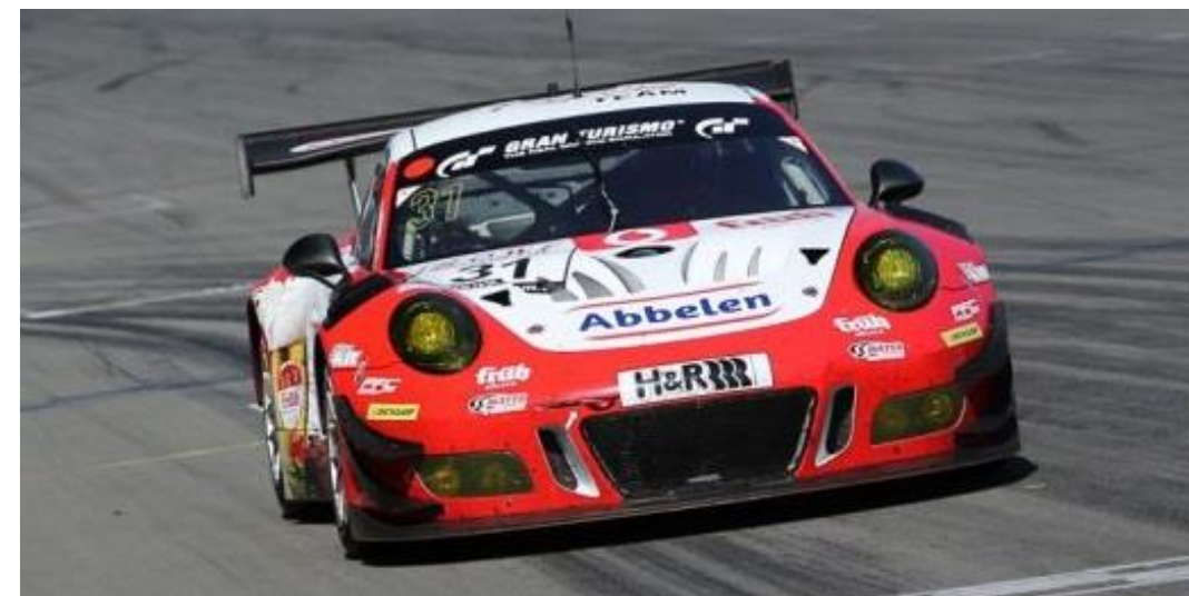
nächstmöglich zum Nummernschild positioniert