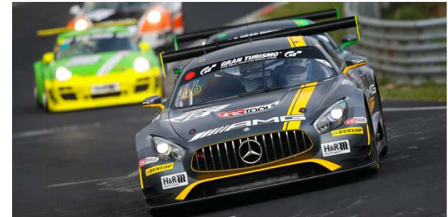
Ausnahmeregelung: 2 Aufkleber (in Absprache mit SPORTTOTAL)