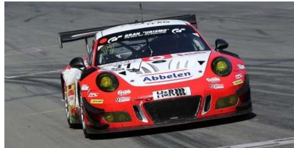
nächstmöglich zum Nummernschild positioniert